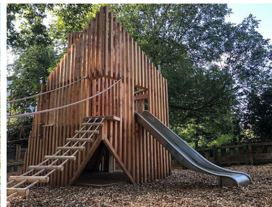
Spännande lekutrustning för olika åldrar