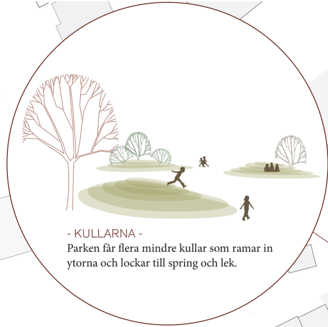
- KULLARNA - Parken får flera mindre kullar som ramar in ytorna och lockar till spring och lek.