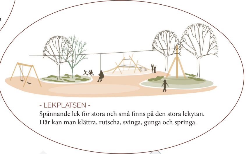
- LEKPLATSEN - Spännande lek för stora och små finns på den stora lekytan. Här kan man klättra, rutscha, svinga, gunga och springa.