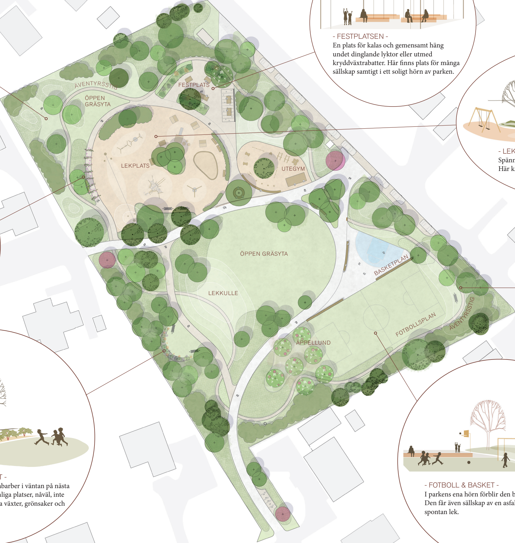
Illustrationsplan skala 1:600 A3 0 10 50m