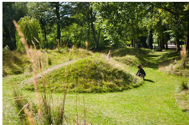
Böljande kullar ramar in på ett lekfullt sätt