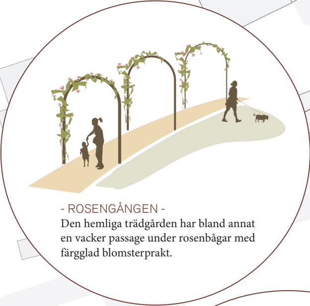
- ROSENGÅNGEN - Den hemliga trädgården har bland annat en vacker passage under rosenbågar med färgglad blomsterprakt.