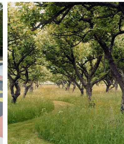
Lämningar efter den hemliga trädgården finns som spår runt om i parken, kanske också som ljus?