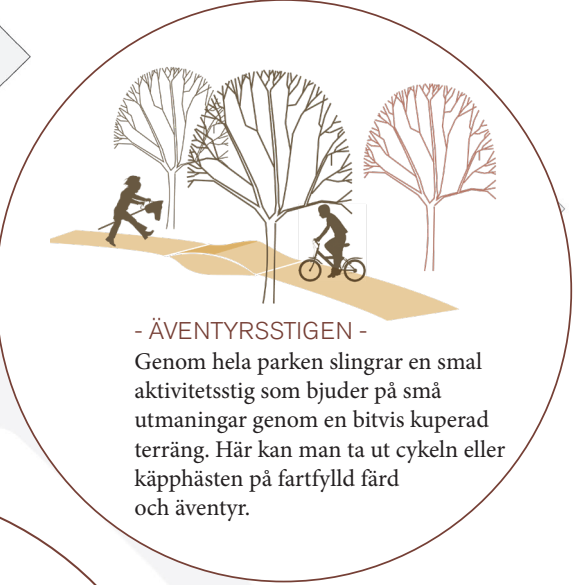
- ÄVENTYRSSTIGEN - Genom hela parken slingrar en smal aktivitetsstig som bjuder på små utmaningar genom en bitvis kuperad terräng. Här kan man ta ut cykeln eller käpphästen på fartfylld färd och äventyr.