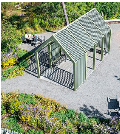
Festplats med pergola och blommande planteringar