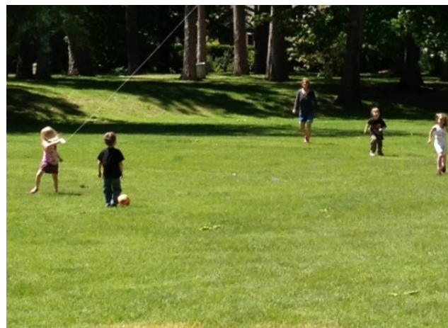
Öppen gräsyta för spontanlek och picknick