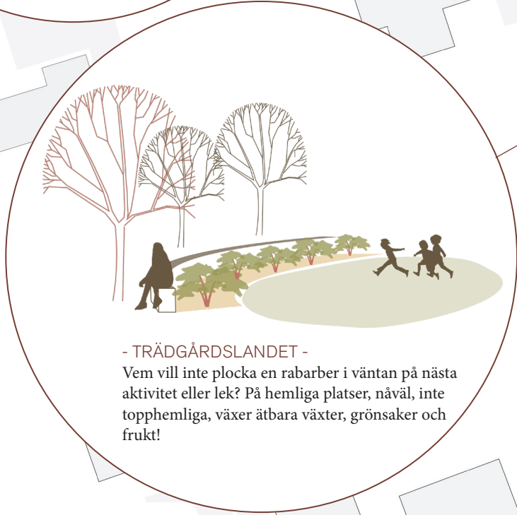
- TRÄDGÅRDSLANDET - Vem vill inte plocka en rabarber i väntan på nästa aktivitet eller lek? På hemliga platser, nåväl, inte topphemliga, växer ätbara växter, grönsaker och frukt!