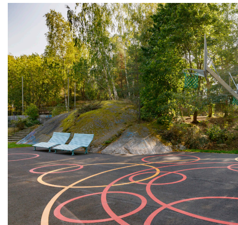
Bollplan med basketkorg för spontanspel och lek