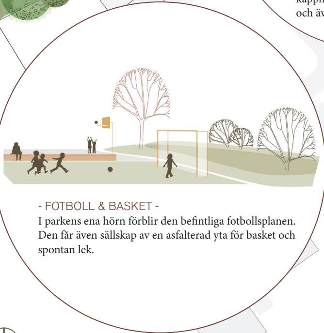
- FOTBOLL & BASKET - I parkens ena hörn förblir den befintliga fotbollsplanen. Den får även sällskap av en asfalterad yta för basket och spontan lek.