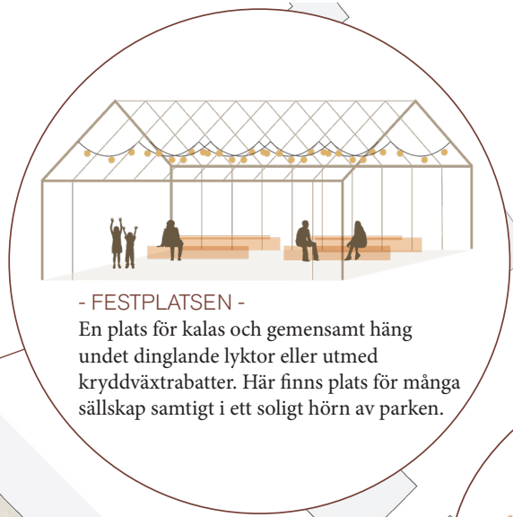
- FESTPLATSEN - En plats för kalas och gemensamt häng under dinglande lyktor eller utmed kryddväxtrabatter. Här finns plats för många sällskap samtigt i ett soligt hörn av parken.