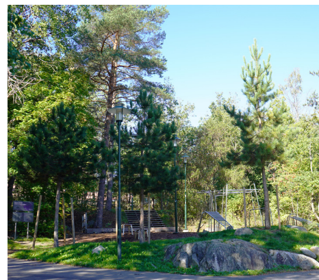
Utegymmet lockar fler målgrupper