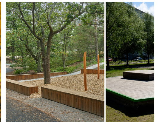
Olika typer av sittplatser och häng för många